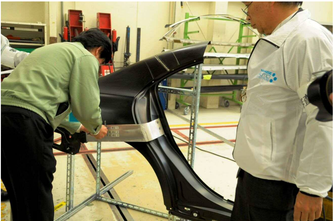
【平面及び曲面の歪みの測定】