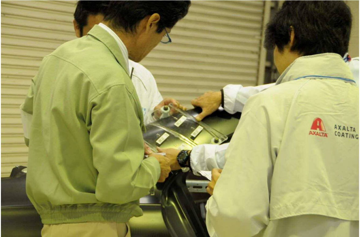
【溶接部分の歪み測定】